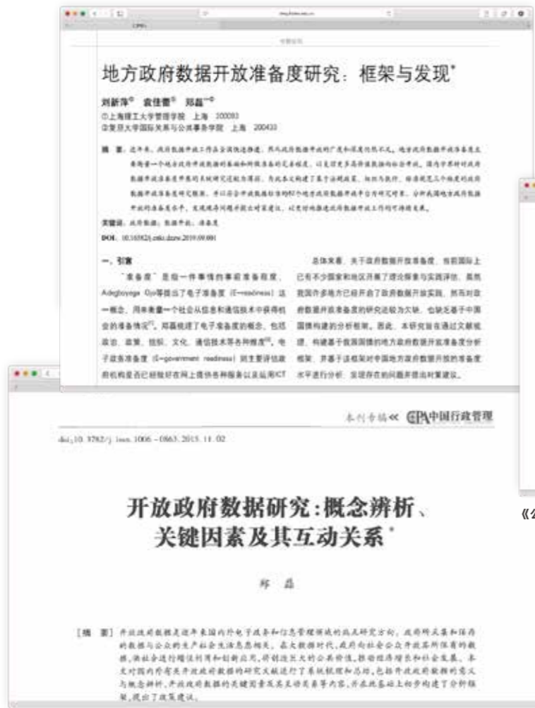
《中国行政管理》，2015年第11期