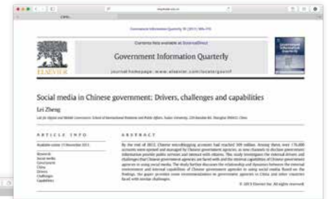
《Government Information Quarterly》2013年11月