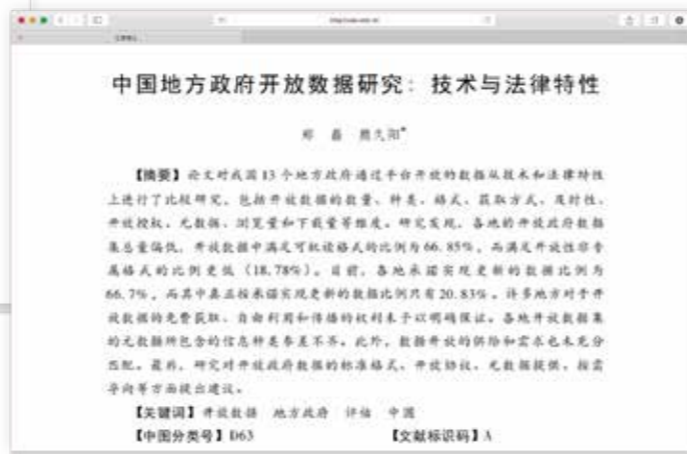
《公共行政评论》，2017年第1期