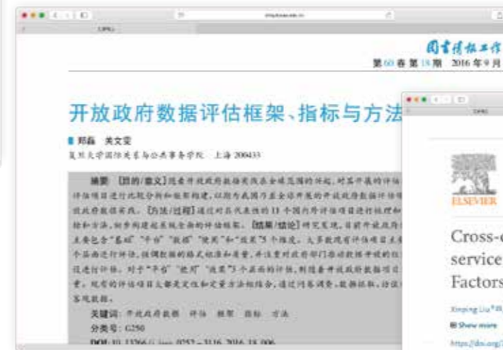
《图书情报工作》，2016年第18期