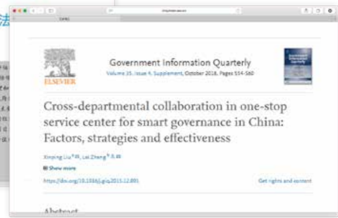
《Government Information Quarterly》2017年6月